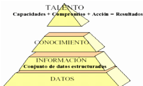
Gráfico 1. Pirámide de Gestión del Talento Humano

Por lo general los trabajadores en algún momento de su vida laboral han experimentado insatisfacción con el empleo o con el clima organizacional y eso conlleva a una preocupación para muchos administradores. Tomando en consideración la continua evolución en la sociedad, estos problemas se tornarán más importantes con el paso del tiempo. Los administradores de talento humano ejercen un rol como personas claves a través del empleo de técnicas, conceptos de gestión con el fin de poder fortalecer la productividad, desempeño laboral, por lo cual las técnicas de trabajo generan impactos en los resultados de las organizaciones. Es así que, si una organización tiene problemas de productividad, para la solución de esa situación, el personal será un factor clave. Es indudable que los activos fijos y financieros son considerados como recursos para la organización, pero el talento humano tiene una importancia sumamente estratégica, porque la gente se encarga del diseño, producción de productos, servicios, control de calidad, distribución de los productos, manejo de los presupuestos en base a los objetivos, de las iniciativas con el fin de generar un desarrollo comercial y financiero en las organizaciones. Sin un equipo de trabajo efectivo es casi imposible que las organizaciones cumplan los objetivos planteados. También se debe considerar que el director de talento humano procurará fortalecer la relación generada entre las organizaciones y el personal. (Hernández & Hernández, 2009)